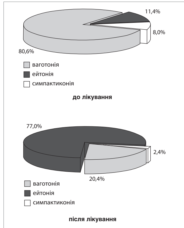
Рис. 1. Показники вихідного вегетативного тону до і після лікування, %

Усі діти мали симптоми, притаманні клініці СВД. Після проведеного комплексного лікування було встановлено стійку позитивну динаміку (табл. 1): зменшились прояви нейроваскулярного синдрому (головний біль, запаморочення), значно знизилась прояви кардіального синдрому (відчуття серцебиття, кардіалгії), регресували прояви дезадаптації (нормалізувався сон, зникли метеочутливість, дратівливість, емоційна лабільність, втомлюваність) та абдомінального синдрому (болі у животі, метеоризм).