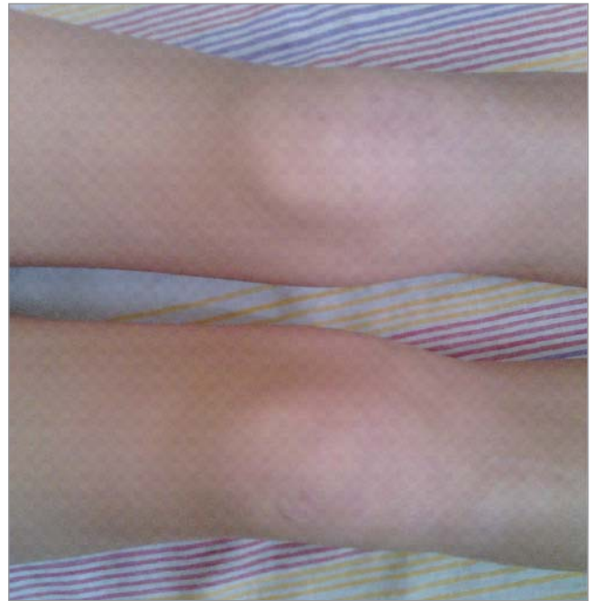
Рис. 1. Внешний вид коленных суставов у ребенка Ц.

УЗИ щитовидной железы: щитовидная железа в типичном месте, контуры ровные, четкие, капсула не уплотнена. Эхогенность паренхимы не изменена, структура ткани однородна. Сосудистый рисунок в режиме ЭДК симметричен, кровотоков не усилен. Объем по Bgrunn правая