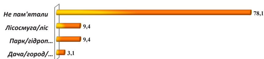
Рис. 1. Місцевість, де відбувалися напади кліщів на вагітних (n=32), %.

Порівнювали частоту виявлення специфічних антитіл до борелій у сироватках крові цих вагітних і у хворих з різними недугами, а також у лісників Тернопільщини. Так, у вагітних зазначені антитіла знаходили частіше, ніж у пацієнтів із туберкульозом, які лікувались стаціонарно у КНП «Тернопільський регіональний фтизіопульмонологічний медичний центр Тернопільської обласної ради», серед яких серопозитивних виявили лише 25,2 % осіб [14], і у хворих із ураженнями нервової системи – 37,0 % пацієнтів, за даними відділу реабілітації Інституту соціальної безпеки міста Мехіко [15]. Проте у пацієнтів з обмеженою склеродермією, які проходили лікування в КУТОР «Тернопільський обласний клінічний шкірно-венерологічний диспансер», інфікованих бореліями було значно більше – 52,5 % осіб [16]. Щодо результатів скри-